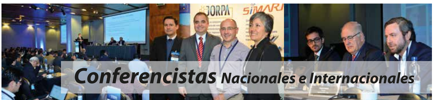
Conferencistas Nacionales e Internacionales

Inscripción pagada Socios patrocinadores, ejemplo Amcham, Cigré u otro 15% CLP $297.500